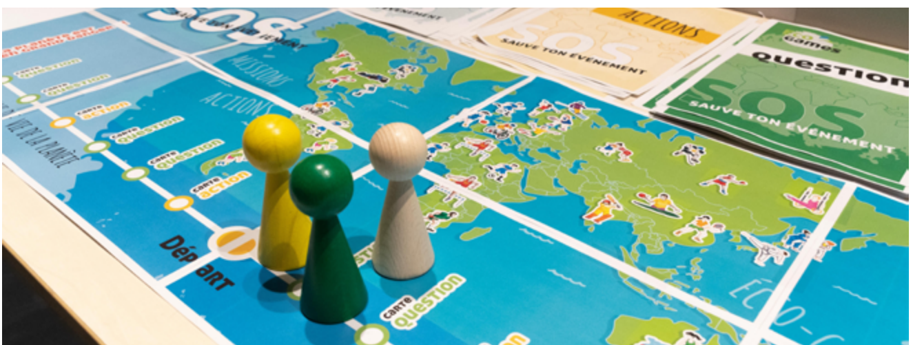
Mallette pédagogique « Eco-Games » réalisée en 2021

Les malettes ont été pensées pour être facilement transportables et peuvent faire l'objet, si besoin, d'une brève formation de la part d'un médiateur culturel du musée.